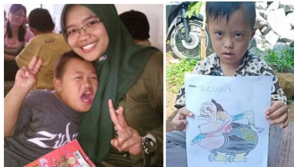
Gambar 2. Pelaksanaan pendampingan (Publikasi foto atas persetujuan orangtua)

Pada hari ketiga, instruksi yang diberikan adalah “pegang biru” pada sesi 1 anak mencapai 80%. Hal ini berarti dalam 10 kali percobaan, anak mampu memberikan respon dengan benar sebanyak 8 kali. Pada sesi kedua, anak tidak dapat mencapai target yang diharapkan. Hal ini karena anak sempat menangis ketika istirahat karena jatuh sehingga membuat mood anak menjadi jelek dan berpengaruh pada respon anak selama intervensi pada hari itu. Pada hari selanjutnya anak kembali dapat mencapai respon kriteria yang diharapkan. Dan pada hari kelima sesi 1 anak telah mencapai mastered untuk instruksi “pegang biru”. Pada hari kelima sesi 2, instruksi ditingkatkan menjadi “pegang kuning”. Pada sesi ini, dari 10 kali percobaan anak mampu memberikan respon benar sebanyak 8 kali. Pada hari keenam, pelaksanaan intervensi dilakukan di rumah anak karena sekolah libur. Dari dua sesi yang dilaksanakan di rumah, anak dapat mencapai 90% dari respon kriteria yang ditargetkan sehingga untuk instruksi “pegang kuning” anak telah mencapai mastered .