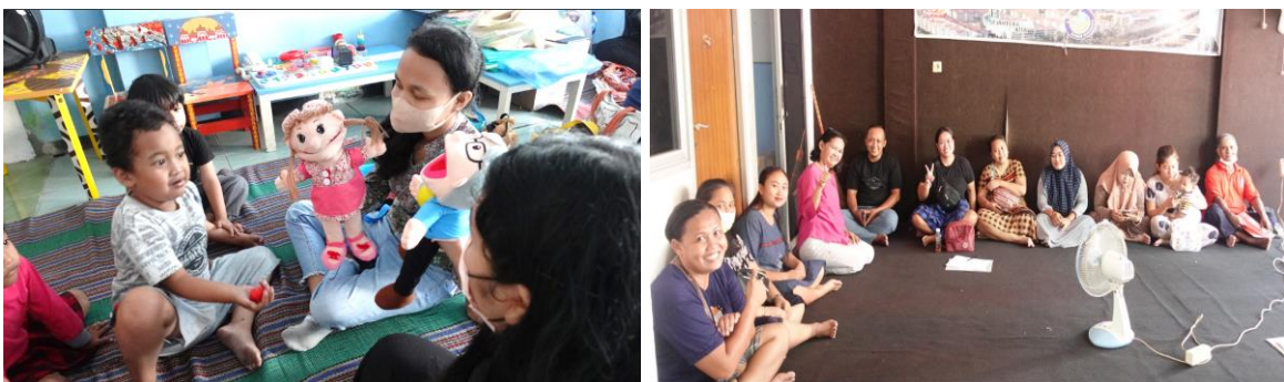
Gambar 5. Sesi bersama anak-anak dan orang tua murid dari PAUD Hati Bapa