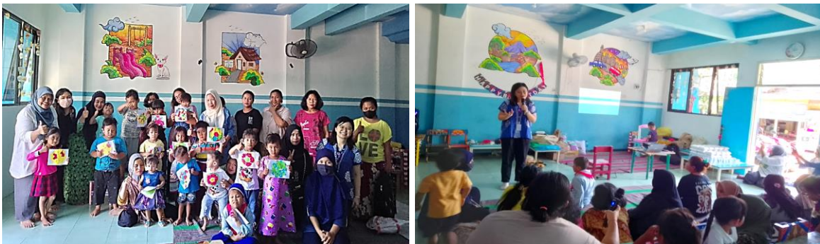
Gambar 4. Sesi bersama anak-anak dan orang tua murid dari PAUD Cahaya Bunda