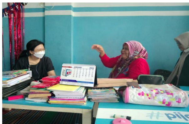
Gambar 3. Tim PkM melakukan diskusi dengan Bunda PAUD Cahaya Bunda