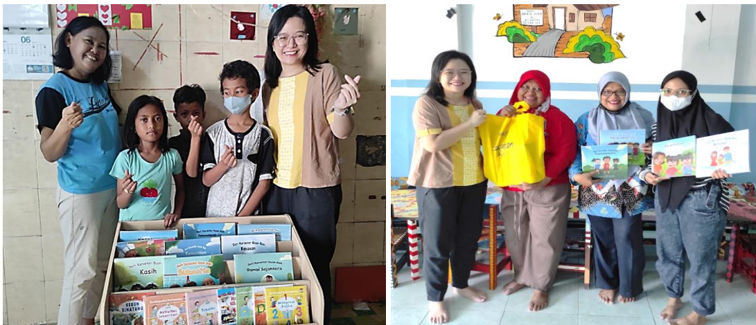
Gambar 8. Pemberian buku Cerita Seri Karakter