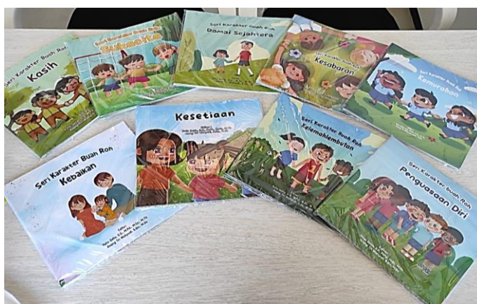
Gambar 1. Buku seri Karakter Buah Roh yang berisi 9 buku

Dalam rangka memberikan penunjang literasi bahasa anak yang berupa pojok baca, diperlukan sarana berupa buku cerita yang sesuai dengan umur agar dapat menarik minat baca anak-anak. Buku cerita yang disediakan merupakan buku yang dibuat sendiri mulai dari isi cerita, ilustrasi sampai pada percetakan buku. Dalam hal ini, yang berpartisipasi untuk membuat buku cerita diantaranya mahasiswa Prodi Pendidikan Guru Pendidikan Anak Usia Dini (PGPAUD) sebagai pengarang cerita dan mahasiswa program studi Desain Komunikasi Visual (DKV) Petra Christian University (PCU) sebagai ilustrator cerita. Buku-buku yang dihasilkan merupakan buku yang sudah diseleksi baik dari segi isi cerita dan juga ilustrasi sehingga buku yang dihasilkan dapat mengembangkan aspek perkembangan pada anak. Seri buku ini adalah Seri Karakter Buah Roh yang terdiri dari 9 buku: Kasih, Sukacita, Damai sejahtera, Kesabaran, Kemurahan, Kebaikan, Kesetiaan, Kelemahlembutan, dan Penguasaan diri.