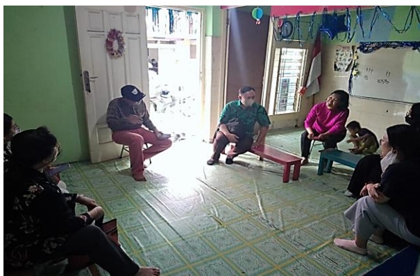
Gambar 2. Tim PkM melakukan diskusi dengan Pak RT Gang Dolly dan Bunda PAUD dari TK Hati Bapa

Diketahui bahwa anak-anak di lingkungan setempat antusias dalam mengikuti proses pembelajaran. Hal ini dibuktikan dengan anak-anak sering datang ke lembaga PAUD untuk belajar bahkan di luar dari jam sekolah biasanya. Namun demikian, oleh tim PkM juga ditemukan fakta menyedihkan mengenai tingkat kemampuan dan minat literasi anak yang masih rendah. Hal ini disebabkan oleh beberapa faktor, seperti tidak adanya fasilitas pojok baca dan kurangnya kesadaran orang tua akan pentingnya kemampuan literasi anak sejak usia dini. Pada kesempatan ini juga, tim PkM menyampaikan rencana untuk melakukan PkM di kedua PAUD tersebut. Para pengelola kedua PAUD dan juga Ketua RT Gang Dolly menerima rencana tim PkM dengan sangat antusias. Ini terlihat dari kehadiran para orang tua dan anak-anak sebagaimana tersaji pada Gambar 2, Gambar 3 dan Tabel. 1.