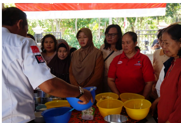
Gambar 3. Pelatihan serta praktik langsung dengan instruktur ahli

Selanjutnya, dilakukan pelatihan teknis pembuatan kue dan bakery berbahan lokal. Materi pelatihan mencakup diversifikasi produk berbasis bahan lokal, teknik standar produksi untuk menjaga kualitas, serta praktik langsung ( hands-on training ) dengan instruktur ahli. Anggota kelompok belajar membuat donat pisang dengan topping berbeda, brownies ubi ungu, dan roti berbahan singkong, sehingga produk menjadi lebih beragam dan memiliki nilai tambah. Pelatihan ini juga menekankan pentingnya konsistensi kualitas dan efisiensi waktu produksi.