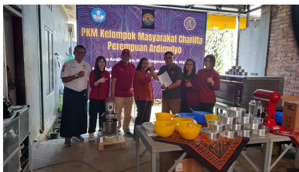
Gambar 2. Tahap persiapan program charitta perempuan

Tahap Persiapan dimulai dengan sosialisasi dan pemetaan kebutuhan. Tim pelaksana mengadakan pertemuan formal dan diskusi kelompok terarah ( focus group discussion ) bersama seluruh anggota Charitta Perempuan. Pada tahap ini, maksud, tujuan, dan manfaat program dijelaskan secara rinci agar anggota memahami peran mereka sebagai subjek aktif dan mitra program. Diskusi juga diarahkan untuk menggali kebutuhan riil kelompok dalam aspek produksi, manajemen usaha, dan pemasaran. Selain itu, potensi sumber daya lokal, seperti bahan baku pisang, singkong, dan ubi yang melimpah, juga diidentifikasi. Dari kegiatan ini dihasilkan peta kebutuhan ( need assessment ) yang menjadi dasar perumusan strategi intervensi selanjutnya.