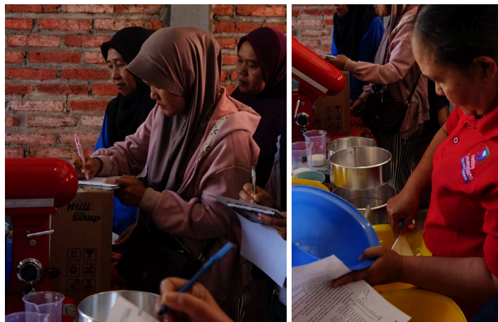
Gambar 4. Pendampingan usaha serta penerapan strategi digital

Tahap Pelaksanaan berupa pendampingan usaha secara intensif. Tim pelaksana mendampingi anggota kelompok dalam menerapkan keterampilan teknis dan manajerial yang telah diperoleh. Pendampingan mencakup pengolahan produk sesuai standar, penyusunan desain kemasan dan merek, serta penerapan strategi pemasaran digital. Pada tahap ini, juga dilakukan penyediaan peralatan produksi tepat guna berupa oven listrik, mixer berkapasitas besar, dan alat pengemasan sederhana. Sebelumnya, kelompok hanya mampu memproduksi sekitar 30 bungkus per hari menggunakan oven manual. Setelah peralatan baru digunakan, kapasitas meningkat dua kali lipat menjadi sekitar 60 bungkus per hari dengan kualitas yang lebih konsisten dan waktu produksi lebih efisien hingga 40%.