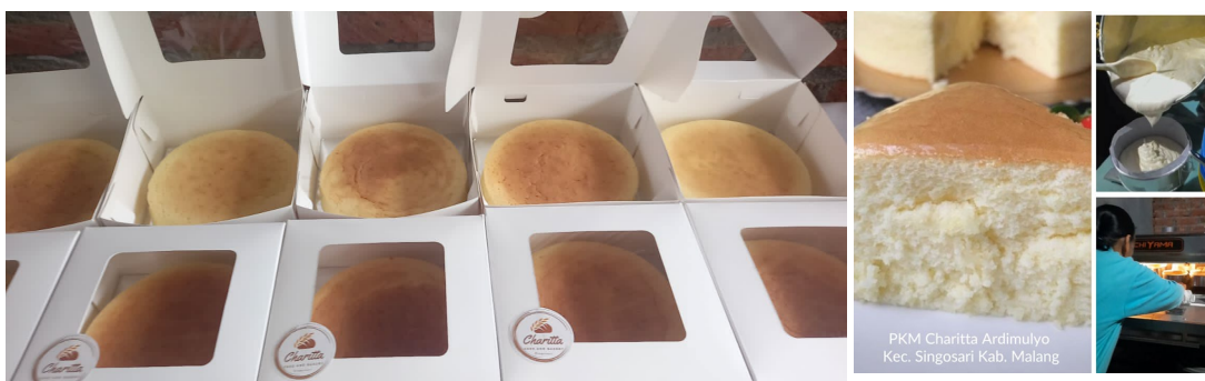
Gambar 5. Desain kemasan produk “Charitta”

Selanjutnya dilakukan pendampingan usaha intensif selama tiga bulan. Tim pelaksana mendampingi anggota dalam praktik langsung pembuatan produk, penyusunan desain kemasan, dan penerapan strategi promosi digital. Hasilnya, kelompok berhasil membuat desain kemasan baru dengan label “Charitta” dan mengunggah konten promosi rutin di media sosial. Anggota juga belajar membagi peran dalam struktur kerja ada yang fokus di produksi, keuangan, hingga promosi sehingga operasional lebih tertata.